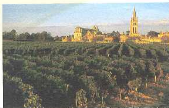
De oude wijnen van de wijngaarden hier van Saint-Emilion